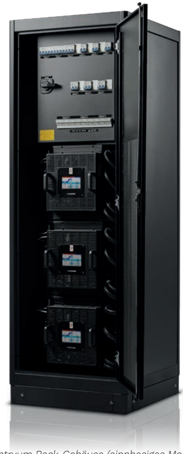
Sentryum Rack-Gehäuse (einphasiges Modell).

Verminderung des Elektrolytverbrauchs und Erhöhung der Gebrauchsdauer von VRLA-Batterien);