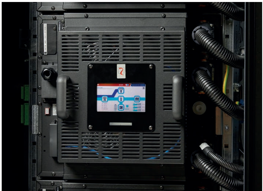
Sentryum Rack-Modul (in 19-Zoll-Gehäuse integrierte Stand-alone-Lösung) – geeignet für Installation in beliebigen 19-Zoll-Gehäusen.